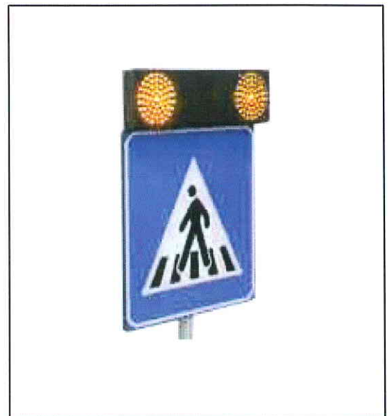
ATTRAVERSAMENTO PEDONALE - fig. 303 C.d.S.