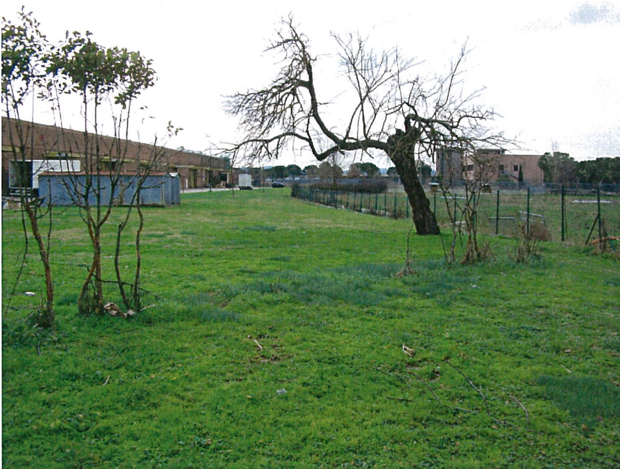
Il tracciato di Via della Manna si perde all'interno delle aree di pertinenza privata