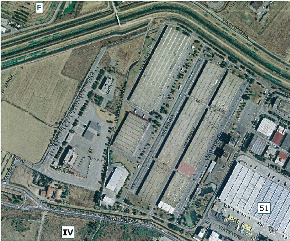
Foto aerea con individuazione della strada vicinale della Manna