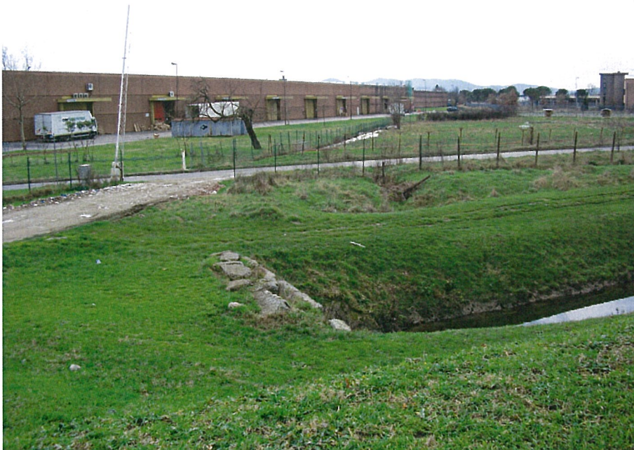
Via della Dogaia e il fosso reale