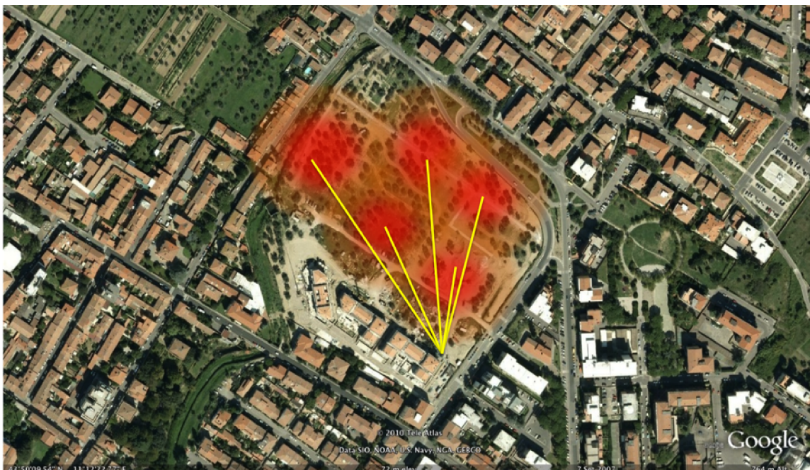
Figura n.3 – Hot spot Parco Oliveta: copertura delle varie celle Wi-Fi e rete di backbone

La distribuzione delle CPE per i due hot spot sono indicate nelle figure n. 3 e 4. In figura n.3 l'area di copertura delle singole celle è stata evidenziata mediante le aree in rosso, mentre i link di colore giallo rappresentano la rete di backbone a 5 GHz.