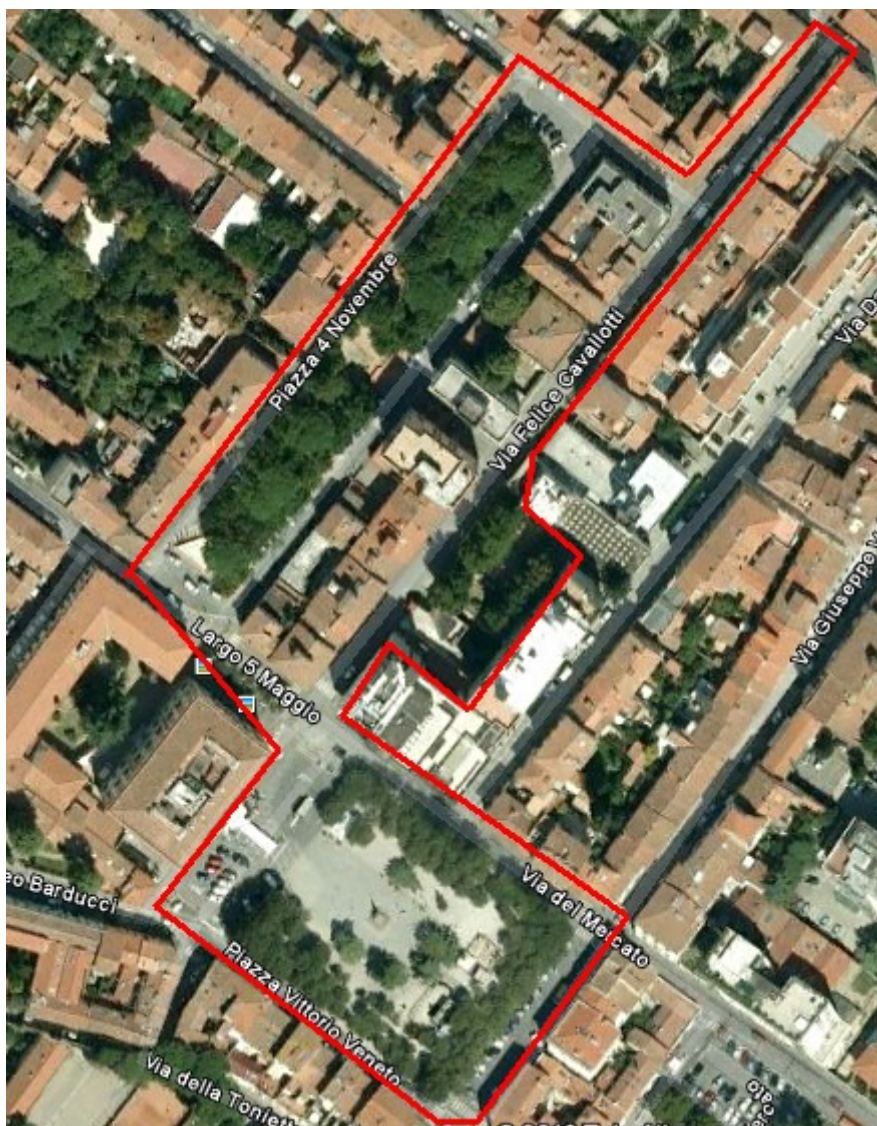
Figura n.2 – Zona del Centro cittadino coperta dalla rete Wi-Fi