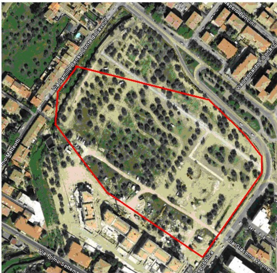
Figura n.1 – Zona del Parco Oliveta coperta dalla rete Wi-Fi

Lo scopo del progetto è quello di definire una soluzione tecnica ed economica per realizzare una copertura di rete wireless, in tecnologia Wi-Fi, di alcune aree cittadine di Sesto Fiorentino. Tali aree sono indicate nelle seguenti figure 1 e 2.