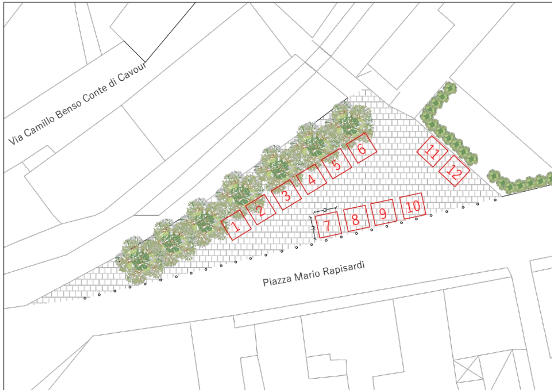
Mercato agricolo di Colonnata - Piazza Rapisardi