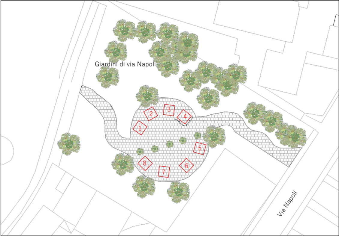
Mercato agricolo di Querceto - Giardini di via Napoli